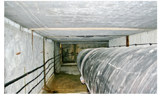
Тоннель под хребтом Кобыла.

«По результатам обследования газопровода в тоннеле через хребет Кобыла было выявлено нарушение целостности изоляционного покрытия. Совместно с работниками службы за-