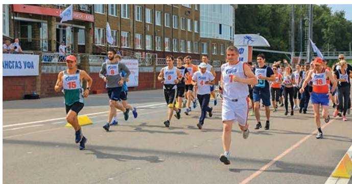
ООО «Газпром трансгаз Уфа»