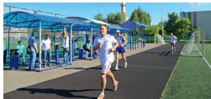
ООО «Газпром трансгаз Москва»