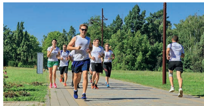
ООО «Газпром трансгаз Краснодар»