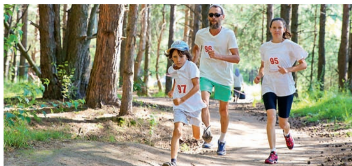
ООО «Газпром трансгаз Чайковский»