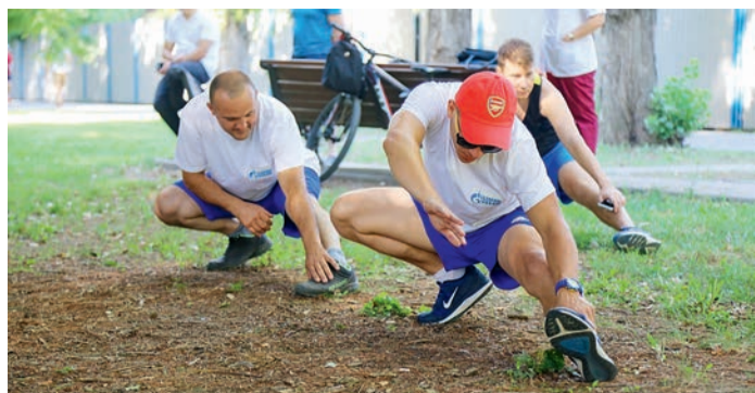
Все участники размялись перед стартом – и вперед!